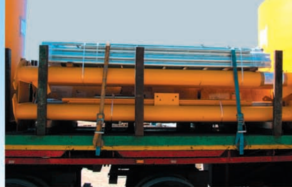
Ein Kranpaket, ein Silo.